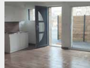
Travaux d'économie d'énergie : isolation, VMC, menuiseries...