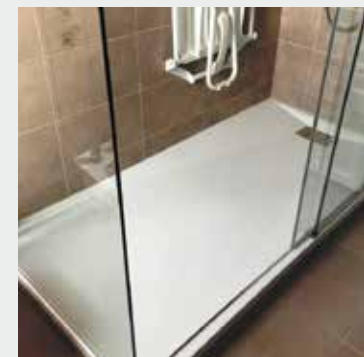
Adaptation d'une salle de bains en salle de douche avec siège et barre d'appui