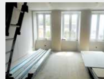
Réhabilitation globale : isolation, menuiseries, gros oeuvre...